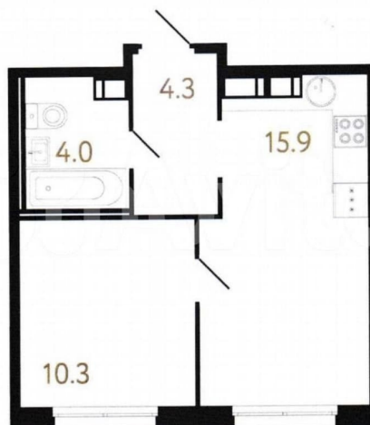
План объекта долевого строительства