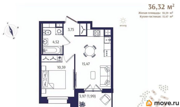
Корпус Б3. План 3 этажа.

— 18 км; - до метро «Беговая» — 50 минут на машине; - до центра Санкт-Петербурга — около 60 км, путь занимает в среднем 60 минут по Зеленогорскому или Приморскому шоссе; - до «Лахта-центра» —