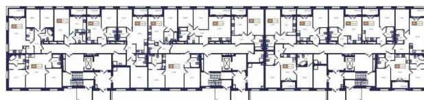
Корпус Б4. План 1 этажа.