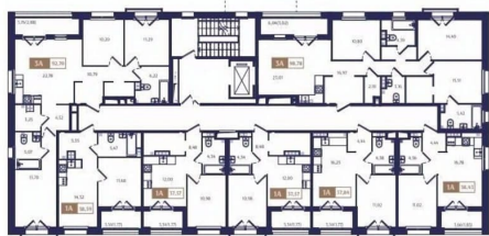
Корпус Б1. План 2 этажа.

просторная планировка, #малоэтажный, закрытый охраняемый двор, #бизнес-класс, панорамные окна, потолки 3 метра.