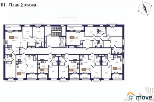
Корпус Б1. План 2 этажа.