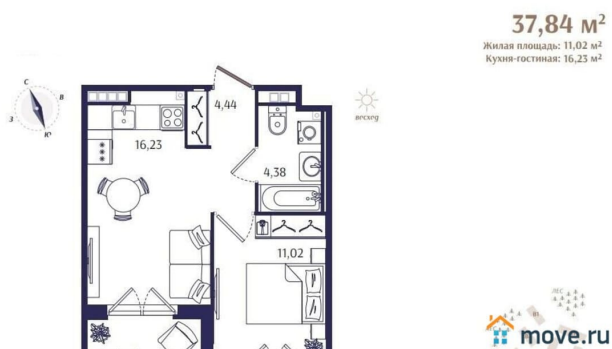
Корпус Б1. План 2 этажа.