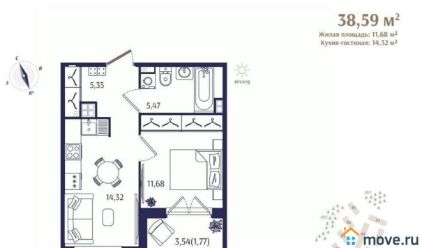
Корпус Б1. План 2 этажа.