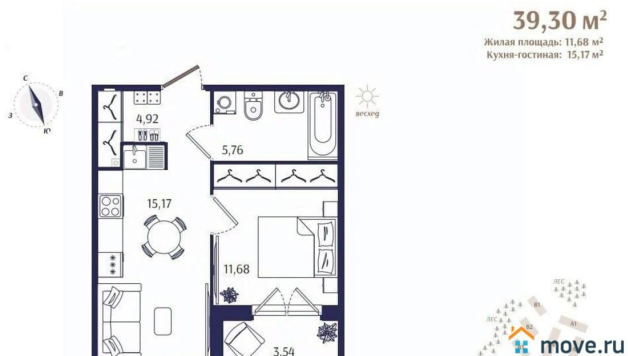
Корпус Б1. План 1 этажа.

#Зеленогорск, #Курортный район, просторная планировка, #малоэтажный, закрытый охраняемый двор, #бизнес-класс, панорамные окна, потолки 3 метра.