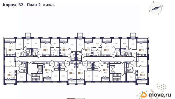
Корпус Б2. План 2 этажа.