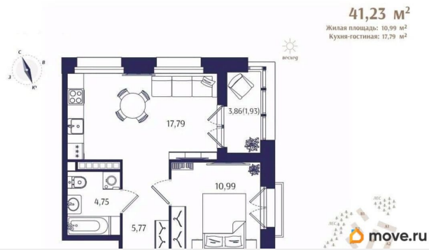
Корпус Б3. План 3 этажа.