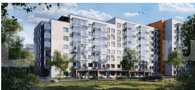
Жилый комплекс Финский квартал Ленинградская область, Бокситовский район, Южковское сельское поселение, д. Луговое, уч. 23