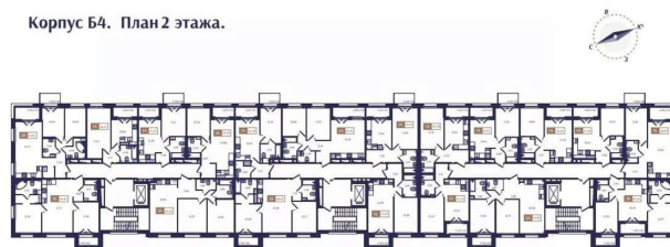
Корпус Б4. План 2 этажа.