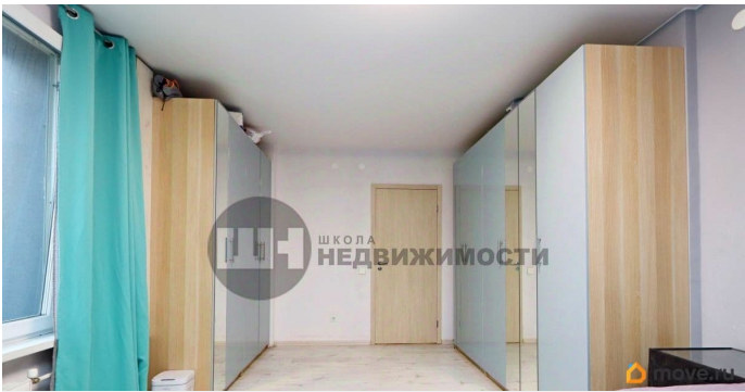
ЖК "Я - РОМАНТИК. СВЕТЛЫЙ МИР"