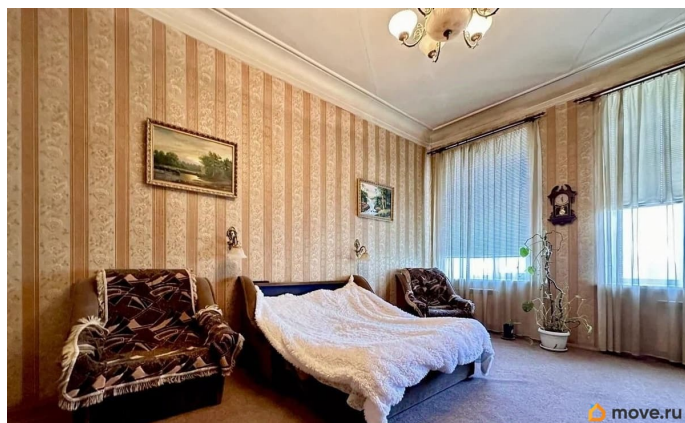
ИЗМАЙЛОВСКИЙ ПРОСПЕКТ, 1