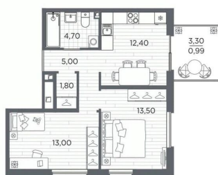
Корпус №0 Этаж 1 из 5 move.ru