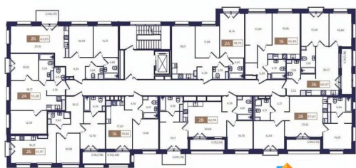
Корпус В5. План 2 этажа.

Кривоносковская 57Д. ЖК Ranta Residence граничит с лесным массивом, также в близости находятся: Государственный природный заказник «Озеро Щучье»; Золотой пляж; Комаровский берег; Зеленогорский парк культуры и отдыха; Горнолыжный курорт Пухтолова гора всего в 15 минутах на автомобиле. Съезда на ЗСД находится в 18 км, до ближайшей станции метро Беговая путь на автомобиле займет в среднем 50 минут, а до центра Санкт-Петербурга путь составит в среднем 60 минут. От ЖК Ranta Residence до центра Санкт-Петербурга около 60 км (по Зеленогорскому или Приморскому шоссе — они идут параллельно). До «Лахта-центра» 45 км и 45 минут в пути. В 15 минутах от ЖК на Вокзале Зеленогорск можно сесть на Ласточку, которая за 55 минут доезжает до Финляндского вокзала, там же есть автобусная остановка, от которой можно доехать к станциям метро Беговая и Черная речка» - этот путь займёт около 1,5 часа. #Зеленогорск, #Курортный район, просторная планировка, #малоэтажный, закрытый охраняемый двор, #бизнес-класс, панорамные окна, потолки 3 метра.