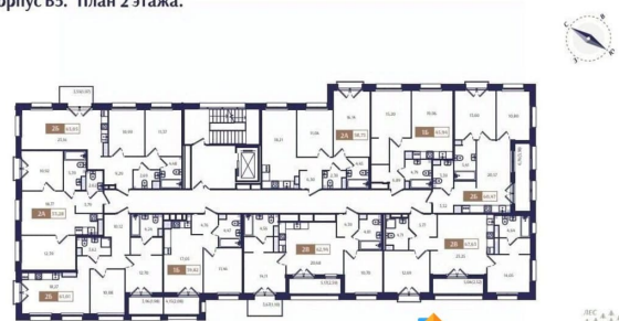
Корпус B5. План 2 этажа.