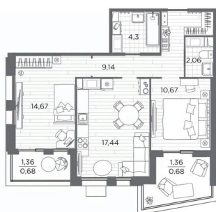
Корпус №6 2 Этаж 7 140 17 Выб move.ru 2 7 11