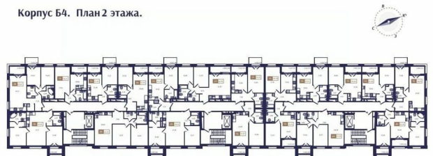
Корпус Б4. План 2 этажа.