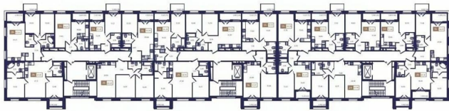
Корпус Б4. План 2 этажа.