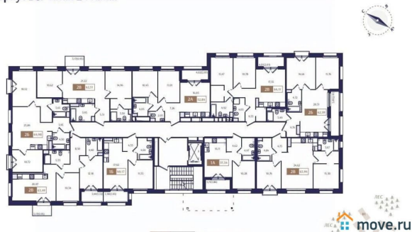
Корпус В6. План 2 этажа.