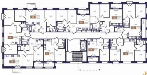
Корпус В6. План 2 этажа.