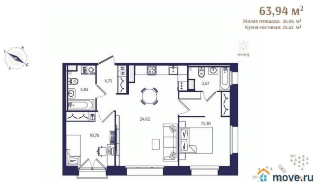
Корпус В4. План 2 этажа.

занимает участок площадью 5,4 Га по адресу: г. Санкт-Петербург, г. Зеленогорск, ул. Кривоносковская 57Д. ЖК Ranta Residence граничит с лесным массивом, также вблизи находятся: Государственный природный заказник «Озеро Щучье»; Золотой пляж; Комаровский берег; Зеленогорский парк культуры и отдыха; Горнолыжный курорт Пухтолова гора всего в 15 минутах на автомобиле. Съезда на ЗСД находится в 18 км, до ближайшей станции метро Беговая путь на автомобиле займет в среднем 50 минут, а до центра Санкт-Петербурга путь составит в среднем 60 минут. От ЖК Ranta Residence до центра Санкт-Петербурга около 60 км (по Зеленогорскому или Приморскому шоссе — они идут параллельно). До «Лахта- центра» 45 км и 45 минут в пути. В 15 минутах от ЖК на Вокзале Зеленогорск можно сесть на Ласточку, которая за 55 минут доезжает до Финляндского вокзала, там же есть автобусная остановка, от которой можно доехать к станциям метро Беговая и Черная речка» - этот путь займёт около 1,5 часа. #Зеленогорск, #Курортный район, просторная планировка, #малоэтажный, закрытый охраняемый двор, #бизнес-класс, панорамные окна, потолки 3 метра.