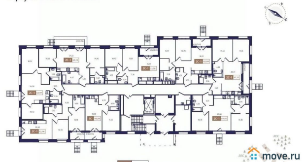
Корпус В4. План 1 этажа.