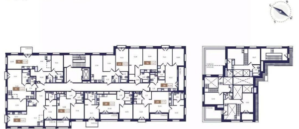
Корпус В5. План 4 этажа.