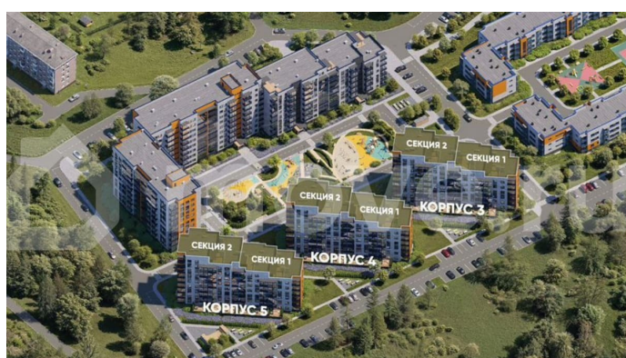
Жилой комплекс Финский Квартал Ленинградская область, Бокситовский район, Южковское сельское поселение, д. Луговое, уч. 23