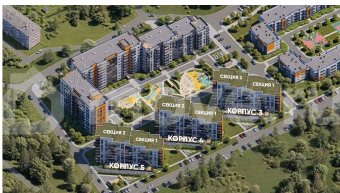
Жилый комплекс Финский Квартал Ленинградская область, Всеволожский район, Южновское сельское поселение, д. Лууполово, уч. 23