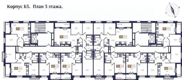
Корпус Б3. План 3 этажа.