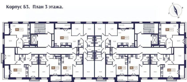
Корпус Б5. План 3 этажа.

закрытый охраняемый двор, #бизнес-класс, панорамные окна, потолки 3 метра.