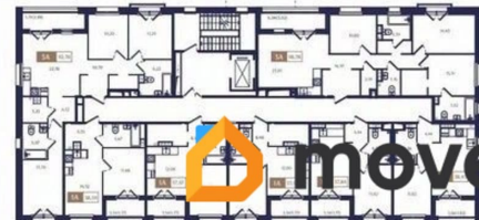
Корпус Б1. План 2 этажа.