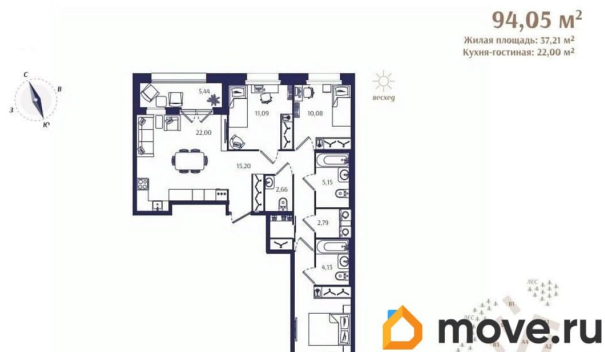
Корпус Б3. План 2 этажа.

ТРАНСПОРТНАЯ ДОСТУПНОСТЬ: - съезд на ЗСД — 18 км; - до метро «Беговая» — 50 минут на машине; - до центра Санкт-Петербурга — около 60 км, путь занимает в среднем 60 минут по Зеленог