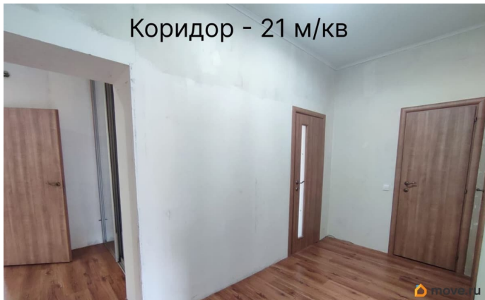
Коридор - 21 м/кв