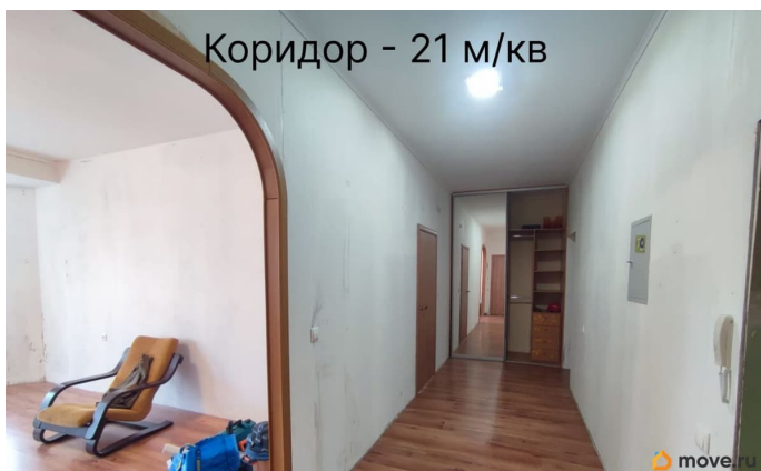
Коридор - 21 м/кв