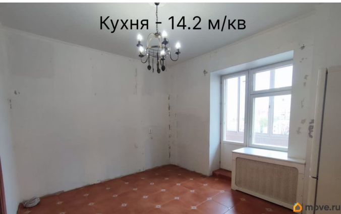
Кухня - 14.2 м/кв