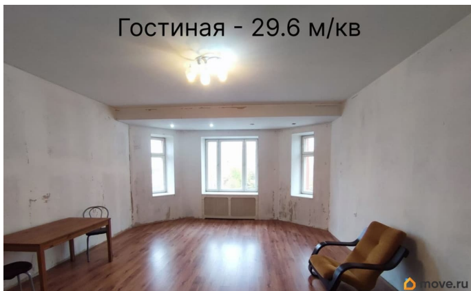
Гостиная - 29.6 м/кв