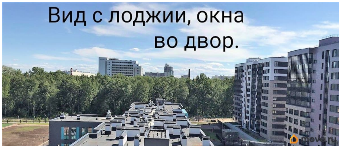
Вид с лоджии, окна во двор.

Уважаемые Агенты, пишите, пожалуйста, сообщения. Продается студия в ЖК высокого комфорт класса ArtLine в Приморском районе. 2020 года постройки. 8 мин пешком до метро Старая деревня. Хороший район, развитая инфраструктура. Лахта центр. Рядом Елагин остров, Крестовский в пешей доступности. Прямая продажа. Единственный собственник. Никто не прописан и не был. По ДДУ был план 25.4м 2 и лоджия 3.8. Реально сдали: студия 24.9м 2 и лоджия 5м 2 . Один арендатор все 5 лет, предпочтительна продажа с продолжением аренды. Предметный торг.