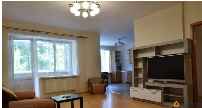
Гостиная, кухня, прихожая. Вид на ул. Главная