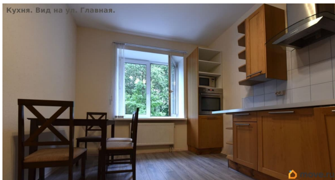
Кухня. Вид на ул. Главная.