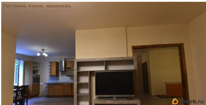
Гостиная, кухня, прихожая.