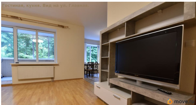
Гостиная, кухня. Вид на ул. Главная.