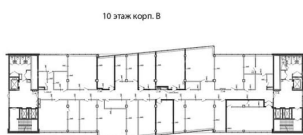
10 этаж корп. В