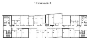
11 этаж корп. В