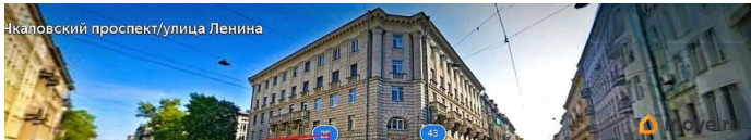
Чкаловский проспект/улица Ленина