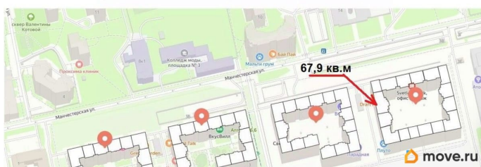
Расположение на карте

Технические характеристики: - Отдельный вход - Площадь 67,9 м² - Мощность 20 кВт - Высота потолков 4,1 м - Вентиляционный выделенный канал - Тепловая завеса - Панорамные окна Развитая инфраструктура: • Svetlana Park новый жилой комплекс бизнес-класса • Перспективная, удобная, престижная локация • Близость к активному пр. Энгельса • Остановки наземного транспорта - 150 метров • Школы и дет.сады • Множество сетевых арендаторов Условия: • Арендная ставка 150 000 руб. в месяц + К/У • Каникулы на обустройство и ремонт • Обеспечительный депозит 100% + комиссия 20% • Договор с ИП а любой срок от 11 месяцев до 5 лет (приоритет длительный срок- регистрация в Росреестре)