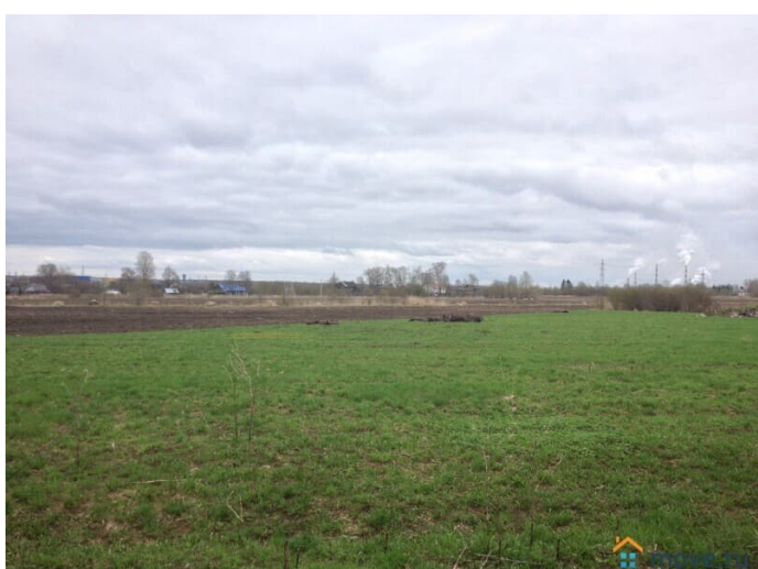
Публичная кадастровая карта 19 га в черте г.Волгоград